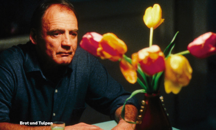
Brot und Tulpen

und dort die Frau trifft, mit der er einst liiert war und die er verlassen hat.