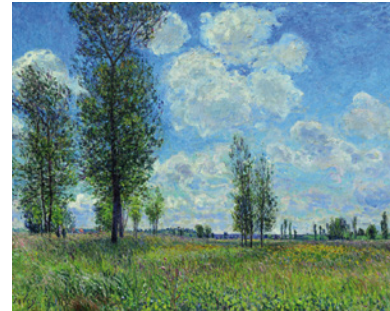
rechts: Alfred Sisley, Wiesen von Veneux-Nadon, 1881

Freitag, 12. Juli 2024 Fahrt zum Wallraf-Richartz-Museum Köln 1863 • PARIS • 1874 REVOLUTION IN DER KUNST