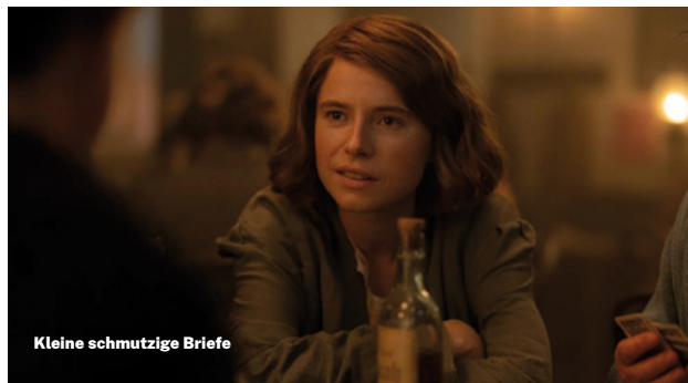
Kleine schmutzige Briefe

Drama F 2023 • 116 min • FSK 12 • 6,00 EUR Ein feinsinniges Drama über einen Schauspieler um die 50, der in ein Wellness-Resort an der Atlantikküste flieht