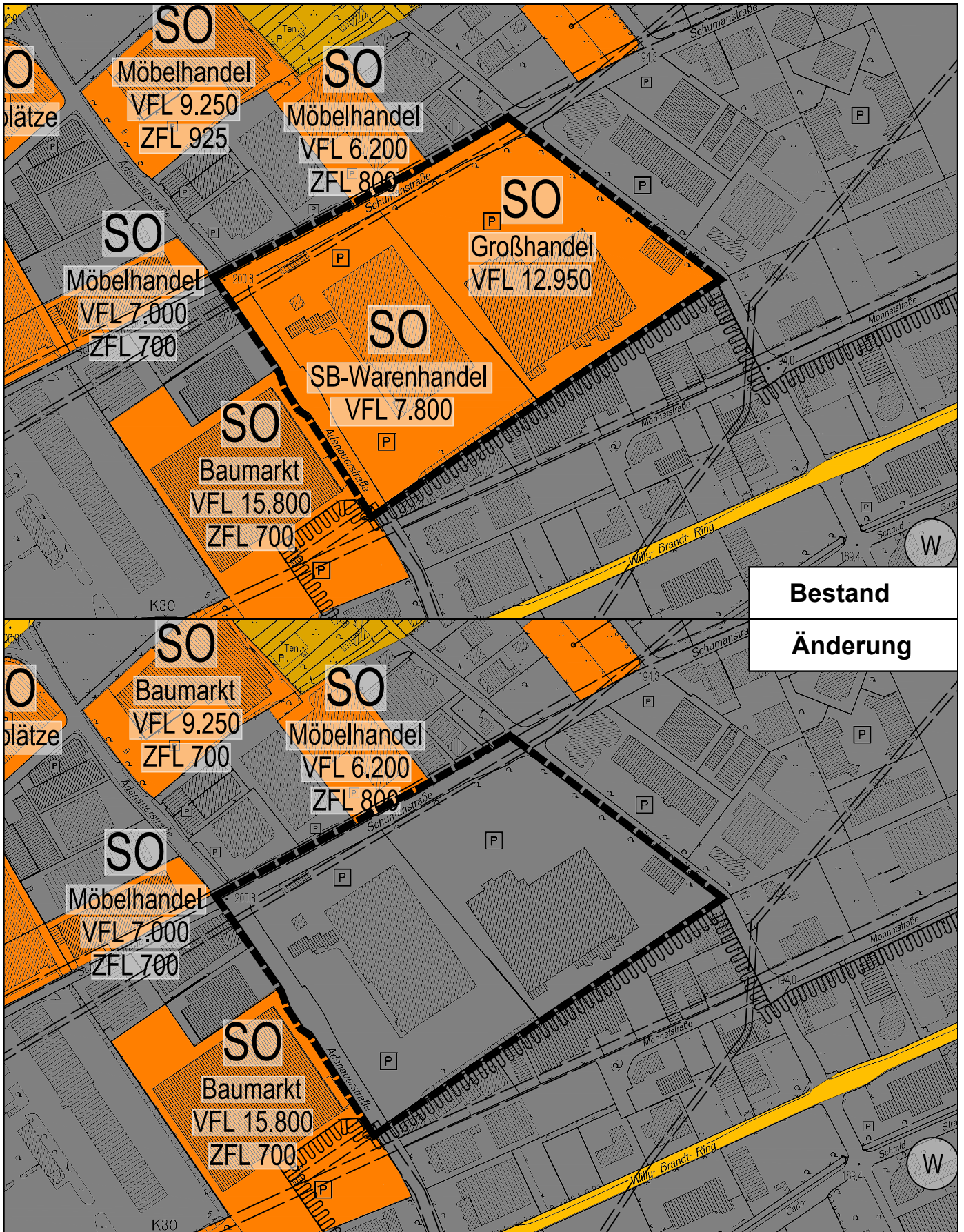
FNP-Änderung Nr. 21 Variante B Bereich: Gewerbegebiet Willy-Brandt-Ring