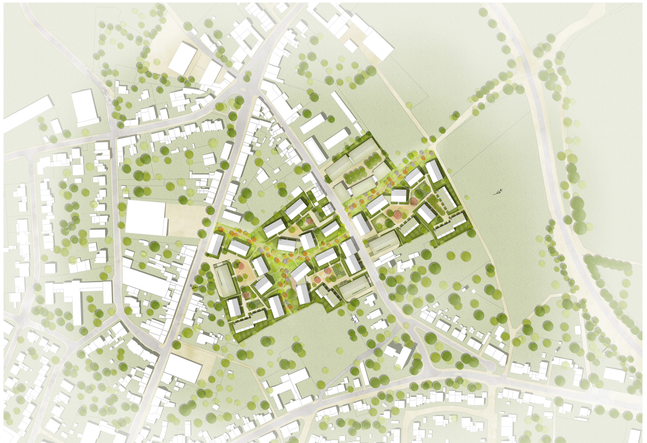
Lageplan M 1:1.000

Erschließung und ruhender Verkehr Ziel ist es, die Wohnhöfe weitgehend autofrei zu gestalten. Alle PKW-Verkehre werden direkt von der Straße in die Scheunen oder unterirdische Stellplätze geleitet. Es erfolgt somit keine unnötige Straßenverlängerung in die Tiefe des Plangebiets. Die Erschließung erfolgt überwiegend über die Nassauer Straße, lediglich einer der Wohnhöfe wird über die Jülicher Straße angegliedert. Die autofreien Höfe verfügen in Straßennähe über ebenerdige Besucherstellplätze und sind in Ausnahmefällen befahrbar. Die notwendigen oberirdischen Stellplätze sind in den Scheunen untergebracht, während sich die unterirdischen Stellplätze in Tiefgaragen unter den Scheunen und angrenzenden Gebäuden befinden und über einen gemeinsamen Zugang im Hof erschlossen werden.