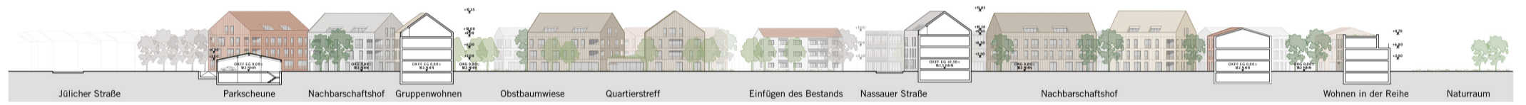
Längsschnitt M 1:500