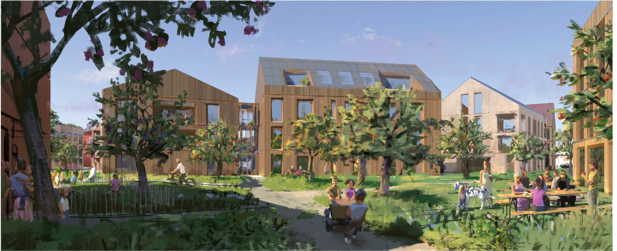
Perspektive Neue Mitte