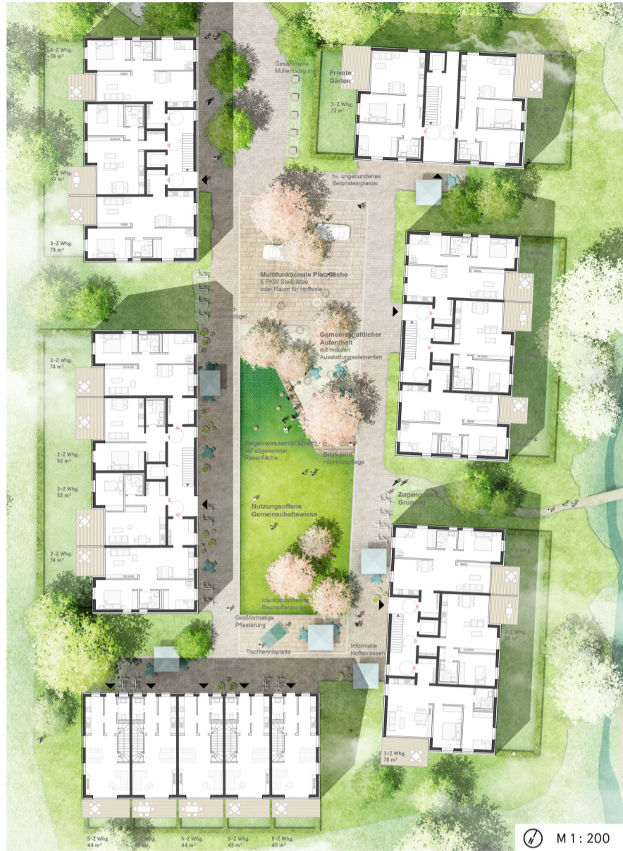
GRUNDRISS EG TEILAUSCHNITT