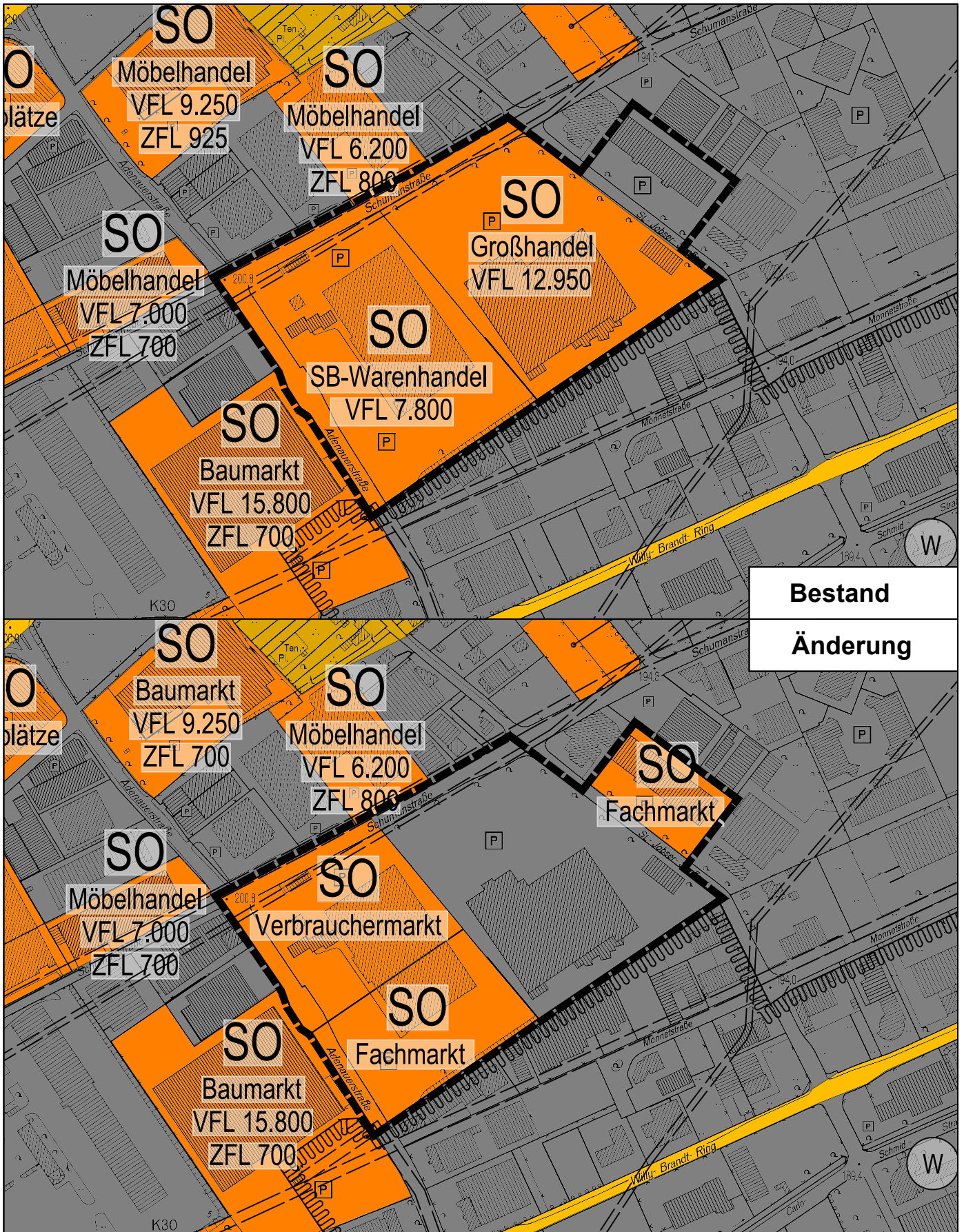
FNP-Änderung Nr. 21 Variante A Bereich: Gewerbegebiet Willy-Brandt-Ring