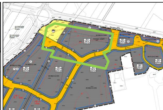
Bereich des Feldflugplatzes (grün markiert)

Zudem wird auf die Meldepflicht und das Veränderungsverbot bei der Entdeckung von Bodendenkmälern gem. §§ 15 und 16 Denkmalschutzgesetz NW hingewiesen. Beim Auftreten archäologischer Bodenfunde oder Befunde ist die Untere Denkmalbehörde bei der Stadt Würselen, Tel. 02405-67534, oder das Rheinische Amt für Bodendenkmalpflege, Außenstelle Nideggen, Zehnthofstraße 45, 52385 Nideggen, Tel. 02425-9039-0, Fax. 02425- 9039-199, unverzüglich zu informieren.